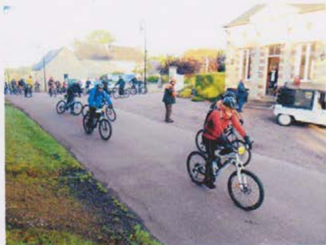
Le Départ des randonnées V.T.T