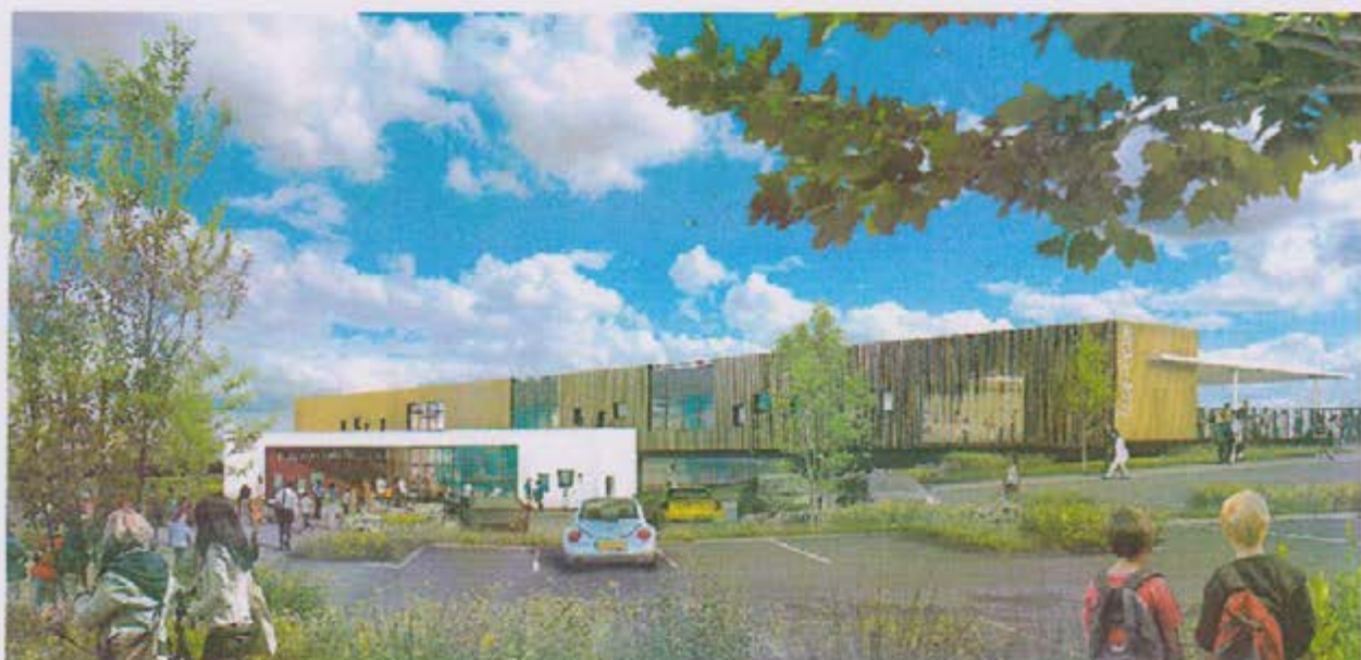
Vue sur entrée des écoles

RENTREE 2014..... ce que vous devez SAVOIR