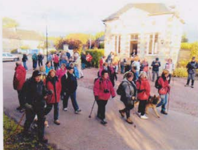
Le Départ de la Randonnée Pédestre