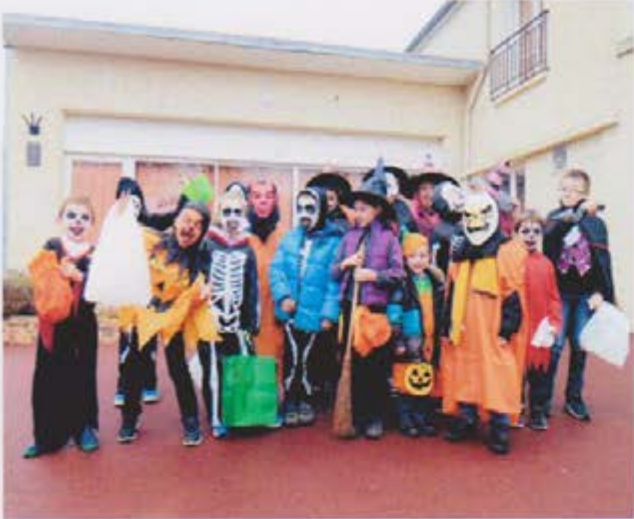
LE GROUPE de 20 enfants