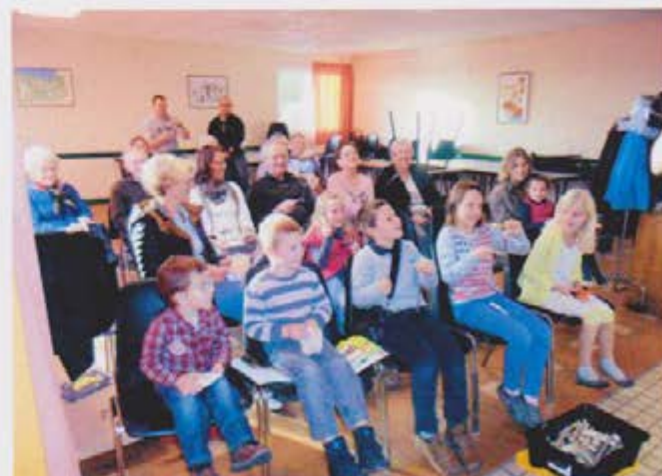
Les spectateurs des DUOZOZIC