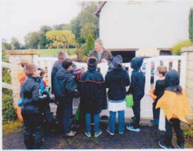
Chez JEAN PIERRE